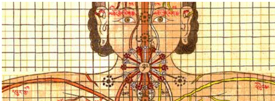
Antike Darstellung des Energiesystems mit seinen Energiebahnen und -zentren

In derselben Weise wurde auch das Energiesystem mit all seinen Energiebahnen und Funktionen erforscht – mit der Erkenntnis, daß in unseren Händen und Fingerspitzen die selbe Lebensenergie und Information frei fließt, die bei blockierten Energietoren stagniert.