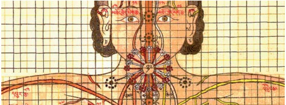
Antike Darstellung des Energiesystems mit seinen Energiebahnen und -zentren

In derselben Weise wurde auch das Energiesystem mit all seinen Energiebahnen und Funktionen erforscht – mit der Erkenntnis, daß in unseren Händen und Fingerspitzen die selbe Lebensenergie und Information frei fließt, die bei blockierten Energietoren stagniert.