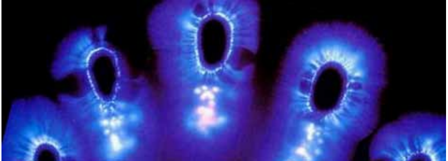
Eine Kirlian® Fotografie zeigt die Energieabstrahlung an unseren Fingerspitzen

Jeder Mensch wendet das Wissen um die Energietore und Energiebahnen ständig (allerdings meist unbewußt und daher nicht sehr effizient) im Alltag in Form von Sprache, Mimik, Gesten, Körperhaltungen und Berührungen an.