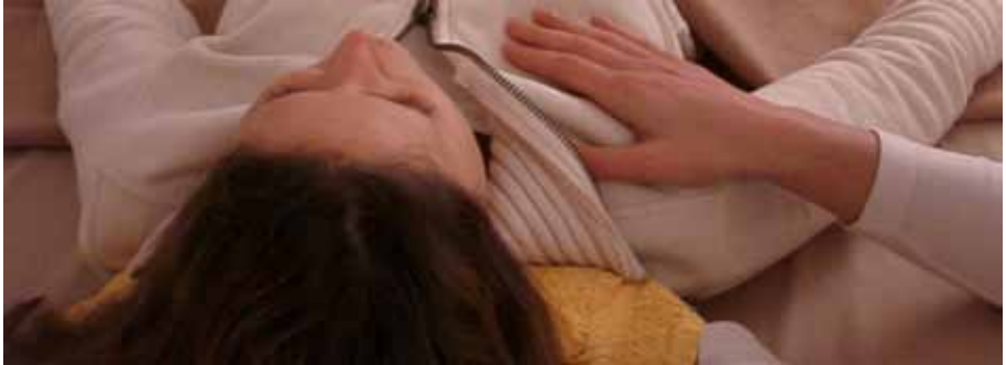
Beim Strömen werden die Energietore sanft berührt und aktiviert

Aufgrund der guten Erfahrungen sind in den letzten Jahren mehrfach Kooperationen mit den Ärzten/innen unserer Kunden/innen entstanden. Besonders in den Bereichen Gesundheitsprävention und -förderung wie auch in der Rehabilitation und Rekonvaleszenz hat sich durch die zahlreichen Erfolge eine kontinuierliche Zusammenarbeit entwickelt.